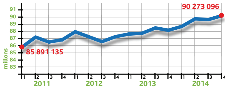
Évolution trimestrielle de la masse salariale de la ZE Vendôme

– citoyens, consommateurs, artisans, agriculteurs et entreprises sociales et solidaires pour ne pas encaisser de points (importations) : avec le Pays vendômois récemment labellisé "territoire à énergie positive", nous nous mobilisons pour réduire notre facture énergétique, rénover thermiquement nos bâtiments, réduire et