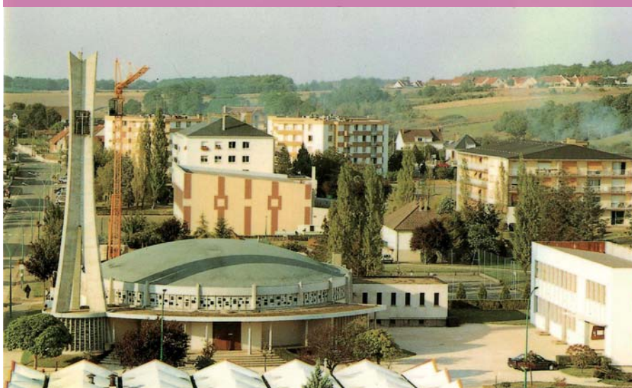
Notre Dame des Rottes