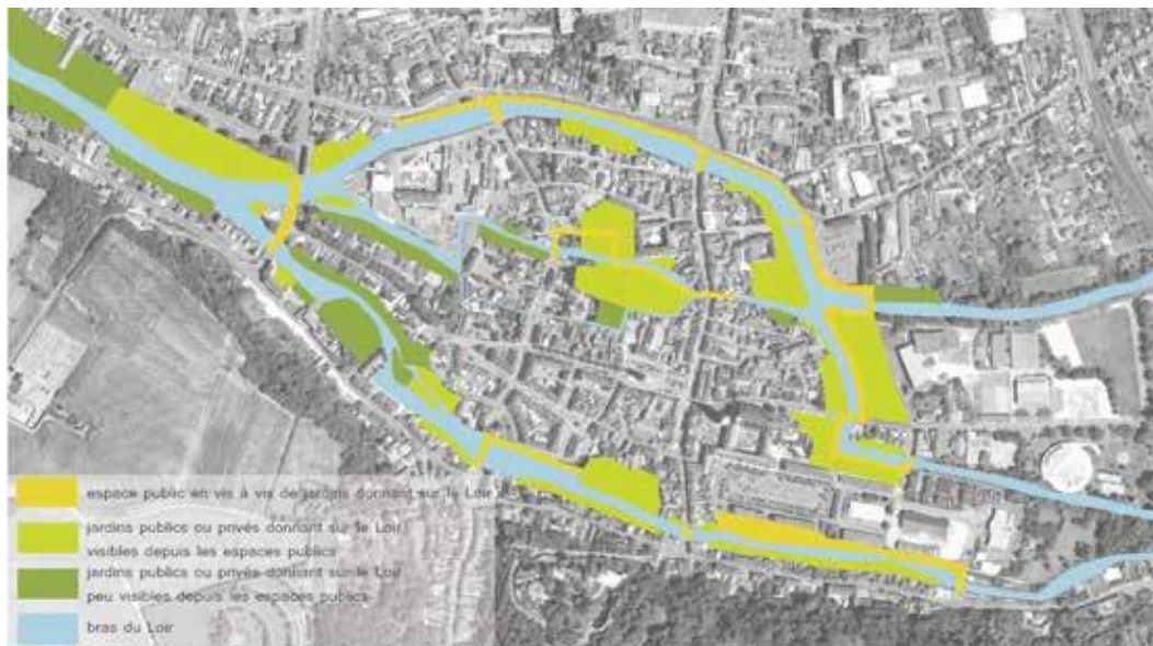
Organisation des vis-à-vis entre jardins et espaces publics à Vendôme