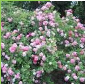
Rosa Yolande d'Aragon