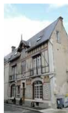
Faux pan de bois