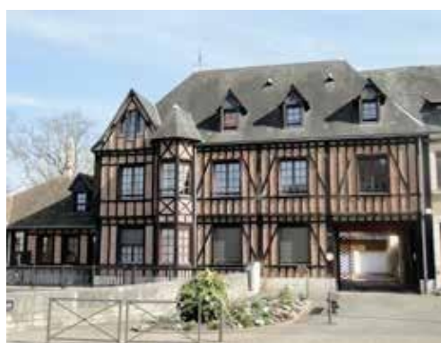
Maison construite en 1948

Au 19 e et au 20 e siècle, le pan de bois retrouve un certain essor et se modernise, avec le remplissage en brique. Les nouveaux matériaux comme le béton, permettent la création de faux pans de bois.