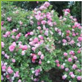
Rosa Yolande d'Aragon