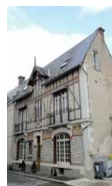
Faux pan de bois