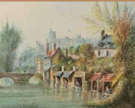
Le Loir par Choupppe - 1840

18 € en vente à l'office de tourisme, il permet de suivre gratuitement toutes les visites du programme.