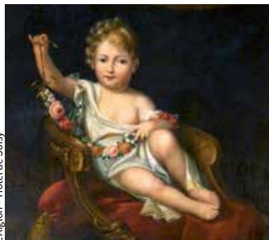
L'Aiglon - Hôtel de Soisy

Un programme sera édité ultérieurement pour informer sur les visites, expositions et animations dans les communes de la communauté d'agglomération Territoires vendômois.