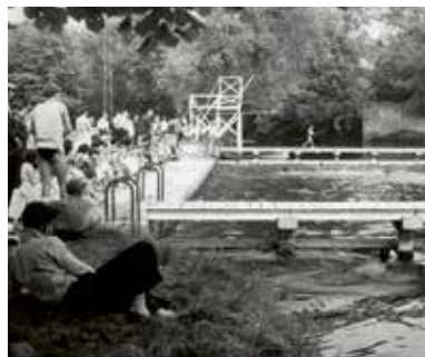
Ancienne baignade sur le Loir

14 h 30 - RV : office de tourisme - Tarif : 4,80 €